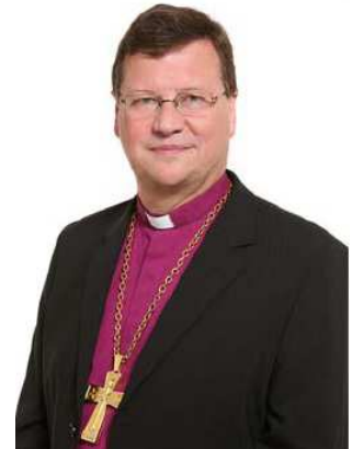
Dr. Hans-Jürgen Abromeit Bischof

im vergangenen Jahr hat es im Leben unserer Kirche eine grundlegende Veränderung gegeben. Zu Pfingsten 2012 haben wir mit unseren Partnern die Evangelisch-Lutherische Kirche in Norddeutschland, kurz Nordkirche, gegründet. In den Wochen vorher hat man deutlich Wehmut und Trauer gespürt: Wurde doch aus der eigenständigen Pommerschen Evangelischen Kirche einer von 13 Kirchenkreisen in der Nordkirche (Pommerscher Evangelischer Kirchenkreis). Für manchen unter uns war dieser Abschied von der Selbständigkeit der Pommerschen Kirche ein gewaltiger emotionaler Einschnitt – auch für mich.