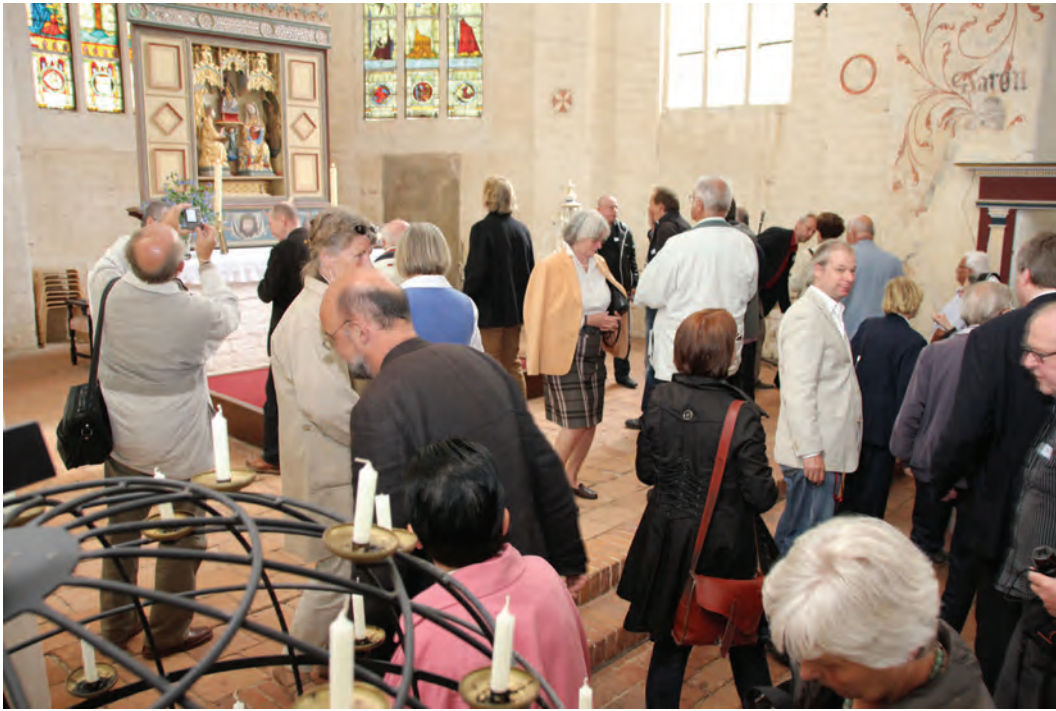
Beliebtes Fotomotiv: der Marienaltar in der Kirche Verchen