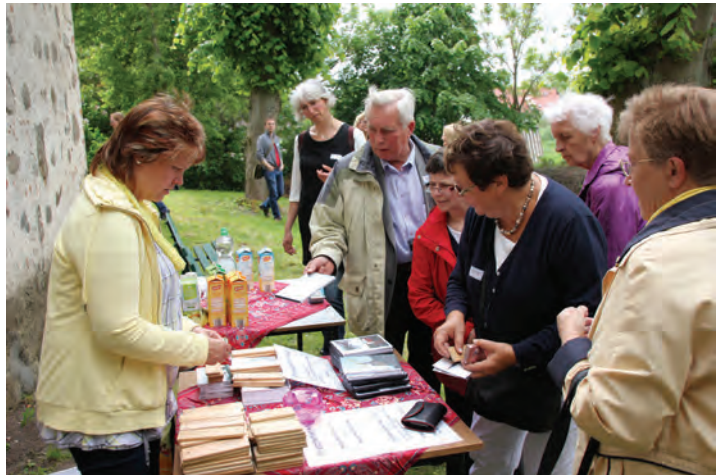
Die Mitglieder des Fördervereins boten Souvenirs an