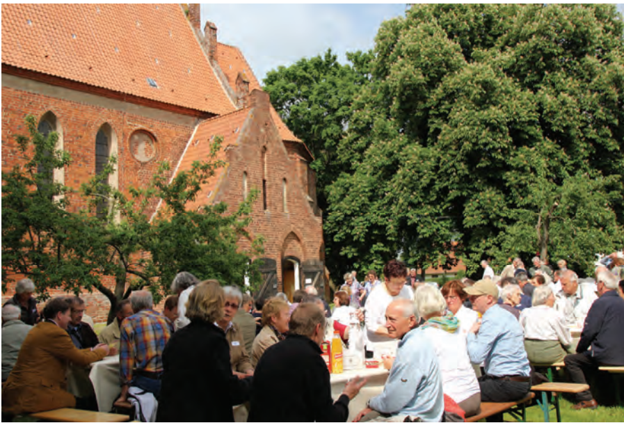
Kaffeetafel im Garten der Klosterkirche Verchen mit Kuchen aus einer bekannten Konditorei der Region