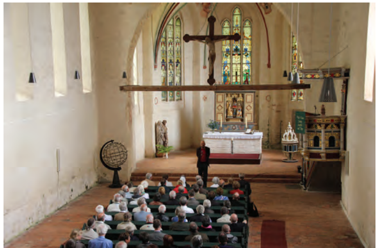
Pastor Detlev Brick begrüßte die Exkursionsteilnehmer und stellte die Gemeinde vor