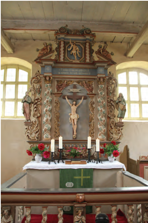
Der imposante Altar

Die Erfahrungen beim Kirchbau wurden gern weiter gegeben