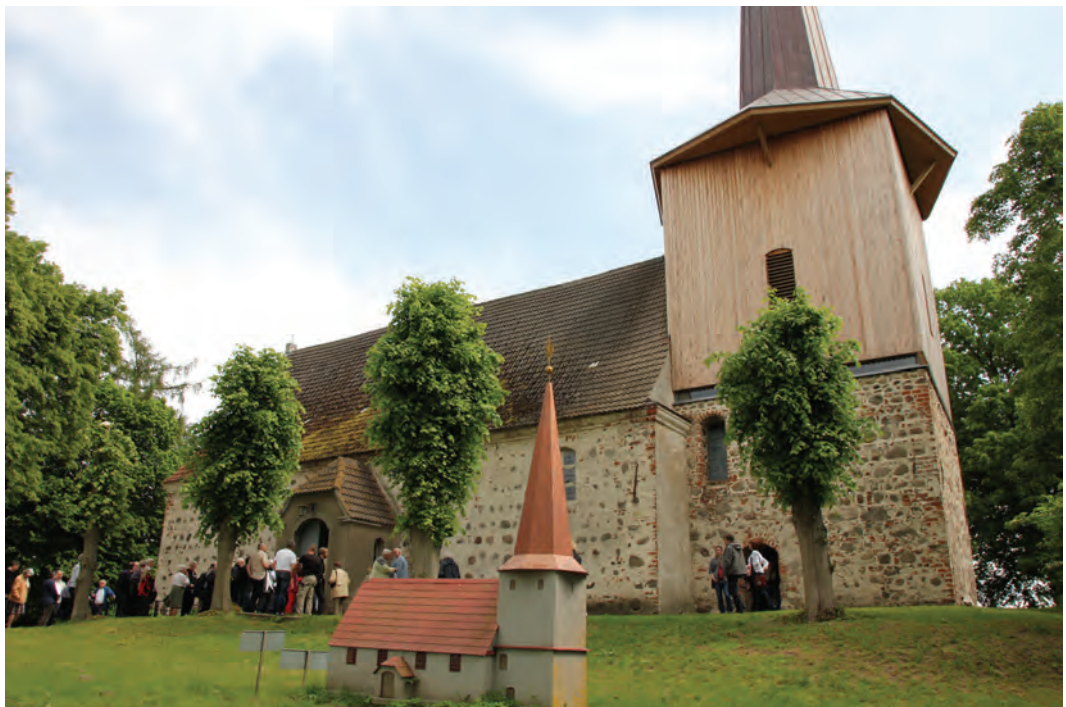
Ein Turmmodell motivierte Gemeindeglieder und Vereinsmitglieder beim großen Bauvorhaben und dem Sammeln von Spenden