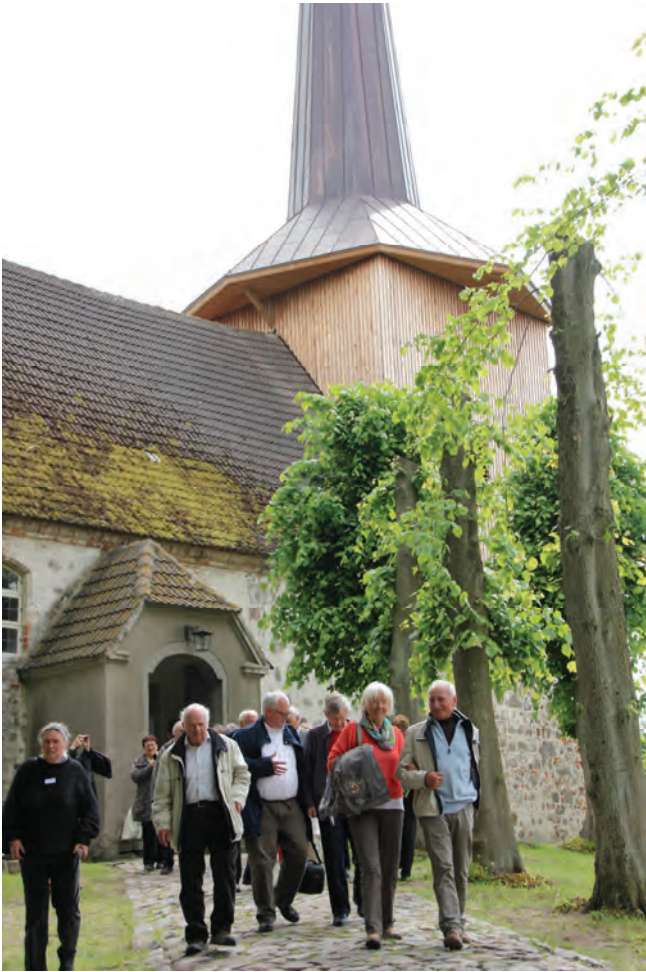
Ragt gen Himmel: der neue Turm der Kirche Lindenberg