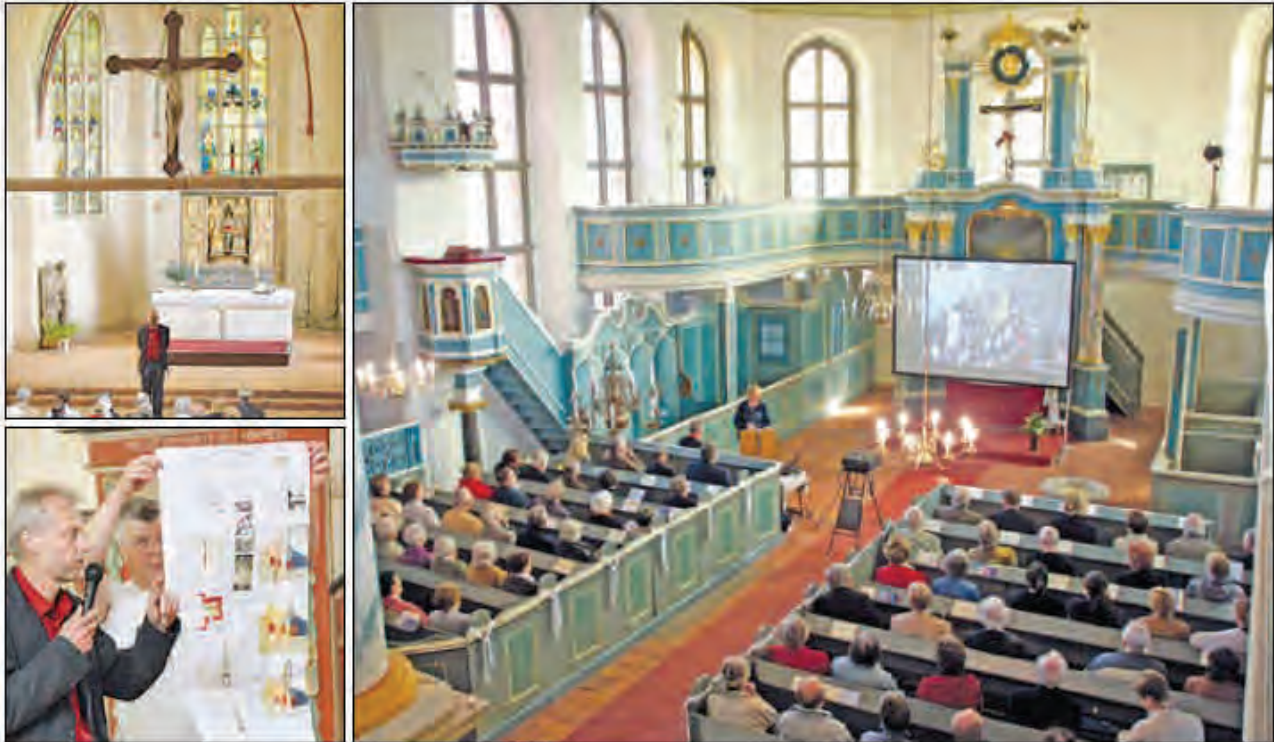
Der diesjährige Tag der Kirchbaufördervereine der Nordkirche fand in der barocken Stadtkirche zu Stavenhagen statt (großes Bild). Exkursionen führten nach Lindenberg (Bild unten) und Verchen im Kirchenkreis Pommern.