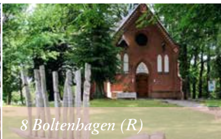
8 Boltenhagen (R)

Kontakt Ev.-Luth. Kirchengem. Klütz-Boltenhagen, Pfarramt Predigerstraße 8, 23948 Klütz, Tel: 038825 - 22274 E-Mail: kluetz-boltenhagen@elkm.de